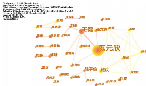
图 2 2000~2022 年我国体育场馆领域作者合作共现图谱

作者合作共现图谱中的节点代表着作者,节点与字号越大意味着该作者的发文量越多,节点的颜色代表着发文时间,不同节点的连线代表着作者之间的合作,连线的颜色代表作者第一次合作的时间,连线的粗细代表作者合作的关联程度。如图 2 所示,网络密度为 0.002 5,表明在体育场馆研究领域作者之间的合作关系并不紧密,但也有不少作者进行合作研究,形成了代表性的研究团队。从图可得,目前形成较有影响力的学术团体有以陈元欣为核心的研究共同体等,团队内部联系较为密切,最突出的合作团队是以学者陈元欣为核心的研究团队,主要研究方向为我国体育场馆的运营与管理,但较多学者仍未形成合作网络,关系疏松。在所有作者中,发文量前 3 位的学者分别为陈元欣(53 篇)、王健(18 篇)和陆亨伯(8 篇)。