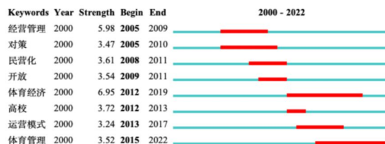
图 6 2000~2022 年我国体育场馆领域关键词突现图谱

突现主题术语能够探测识别某一领域发展的前沿与新兴趋势,通过 CiteSpace 的分析突现词,得到我国体育场馆研究主题的词频分布及研究趋势,见下图 6 所示。