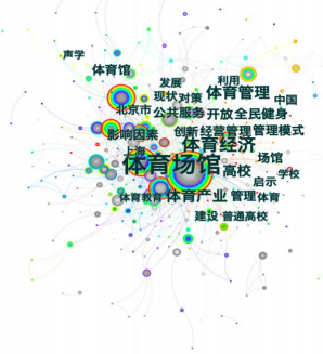
图 3 2000~2022 年我国体育馆关键词共现图谱

CiteSpace, v. 5.1.R3 (64-bit) Basic September 19, 2022 at 9:00:18 PM CST CNKI: (Users:fangzhi/Desktop/cite space/体育馆forCNKI)/data Timespan: 2000-2022 (Slice Length=1) Selection Criteria: q=0.25, LRF=3.0, L/N=10, LBY=5, e=1.0 Network: N=512, E=940 (Density=0.0072) Largest CC: 402 (78%) Nodes Labeled: 1.0% Pruning: None