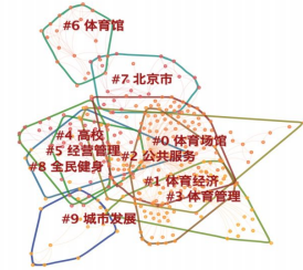
图 4 2000~2022 年我国体育馆领域关键词聚类图谱

CiteSpace, v. 5.1.R3 (64-bit) Basic September 19, 2022 at 1:45:27 AM CST CNKI: (Users:fangzhi/Desktop/cite space/体育馆forCNKI)/data Timespan: 2000-2022 (Slice Length=1) Selection Criteria: q=0.25, LRF=3.0, L/N=10, LBY=5, e=1.0 Network: N=512, E=940 (Density=0.0072) Largest CC: 402 (78%) Nodes Labeled: 1.0% Pruning: None Modularity Q=0.6114 Weighted Mean Silhouette S=0.9326 Harmonic Mean Q, S=0.7386